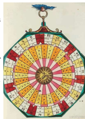
Kalender von Peter Apian